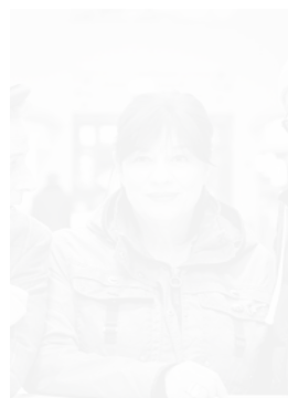
Ulla Meinecke begeistert zusammen mit ihrer Band