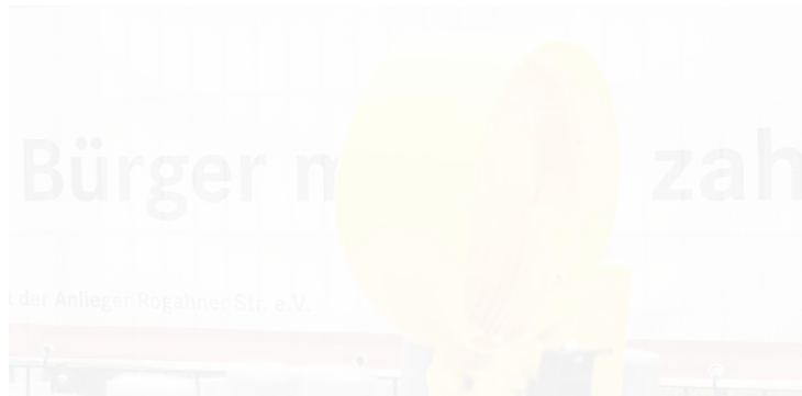
Im Amt Crivitz sind zehn Bürgermeister ratlos: Wie sollen sie ihren Bürgern erklären, dass diese jetzt noch Straßenausbaubeiträge für 2015 bis 2017 zahlen müssen?

„In Einwohnerversammlungen müssen wir vor Ort erläutern, warum unsere Bürger für die Vergangenheit noch zahlen müssen. Dass dies zutiefst ungerecht gegenüber anderen empfunden wird – zum Beispiel gegenüber Gemeinden, die nach diversen Zeitungsberichten entgegen der Rechtslage geäußert haben, nicht mehr zu