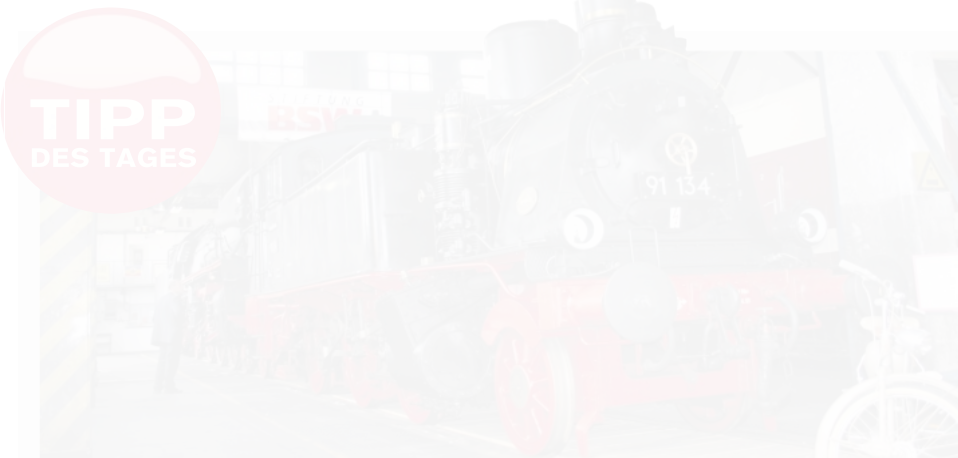
Die Dampflok 91 134 des Eisenbahn- und Technikmuseums ist derzeit nach Sachsen ausgeliehen.

Asterix und das Geheimnis des Zaubertranks (o.A.), Sa./So. 10 Uhr Willkommen im Wunder Park