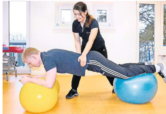
Die Ausbildung zur Physiotherapeutin an der „ecolea“.

An der „ecolea“ gibt es eine enge Verzahnung von Theorie und Praxis. Die Ausbildung zum Physiotherapeuten dauert insgesamt drei Jahre. Im ersten Jahr werden die theoretischen Grundlagen gelehrt. Das zweite Ausbildungsjahr beginnt mit dem ersten Praktikum. Im weiteren Verlauf stellt sich ein ausgeglichener Wechsel zwischen Praxis und Theorie ein. Der praxisnahe Unterricht in der Schule ist dabei besonders hilfreich. Das hier Gelernte hilft einem