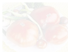
Die Ochsenherztomaten sind groß gewachsen.